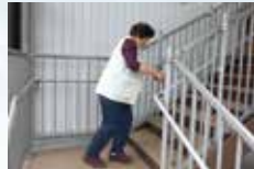
生活機能向上訓練(階段昇降)