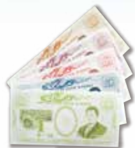
施設内通貨「ま〜ブル」

無目的なレクリエーションは退行や依存を誘発させるためしません。その代り、リハビリを楽しく行えるように施設内通貨を利用出来たり、個別サービスには100種を超えるリハビリメニューがあります。「旅行に行きたい」などの目標を叶えられるよう支援します!