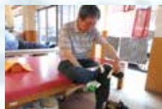
生活機能向上訓練(装具の装着)

高齢者に多い、生活不活性病(廃用症候群)の予防に必要なのは、その方の心身機能に合わせて、できるだけご自身でやって頂くこと。創心會では、介護スタッフ・看護師・療法士を問わず社内勉強会でリハビリについて学んでいるので、「何でもする」過剰介護はしません。