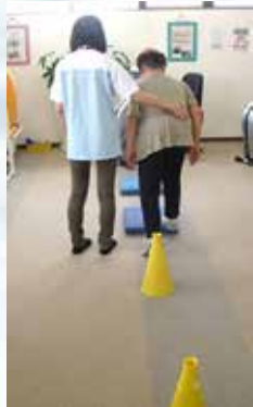
生活機能向上訓練(歩行訓練)

高齢者に多い、生活不活性病(廃用症候群)の予防に必要なのは、その方の心身機能に合わせて、できるだけご自身でやって頂くこと。創心會では、介護スタッフ・看護師・療法士を問わず社内勉強会でリハビリについて学んでいるので、「何でもする」過剰介護はしません。