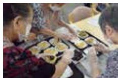
おやつリハ(不定期)

無目的なレクリエーションは退行や依存を誘発させるためしません。その代り、リハビリを楽しく行えるように施設内通貨を利用出来たり、個別サービスには100種を超えるリハビリメニューがあります。「旅行に行きたい」などの目標を叶えられるよう支援します!