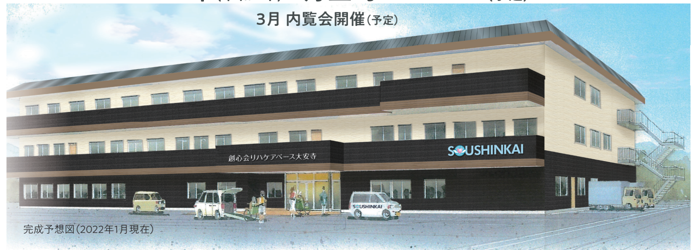
完成予想図(2022年1月現在)